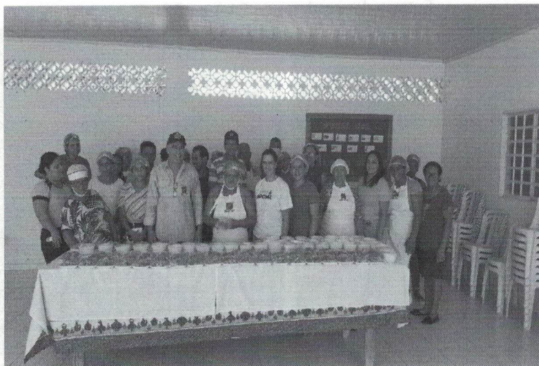
Curso de doces artesanais PA I & II