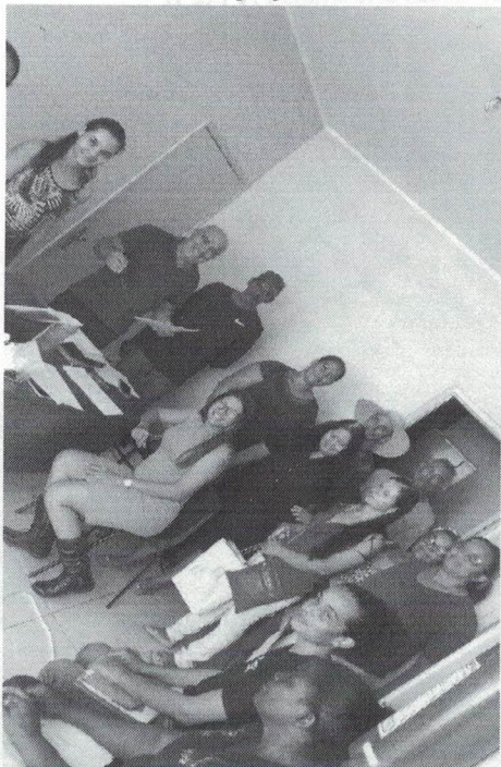
Elaboração dos projetos do PAA