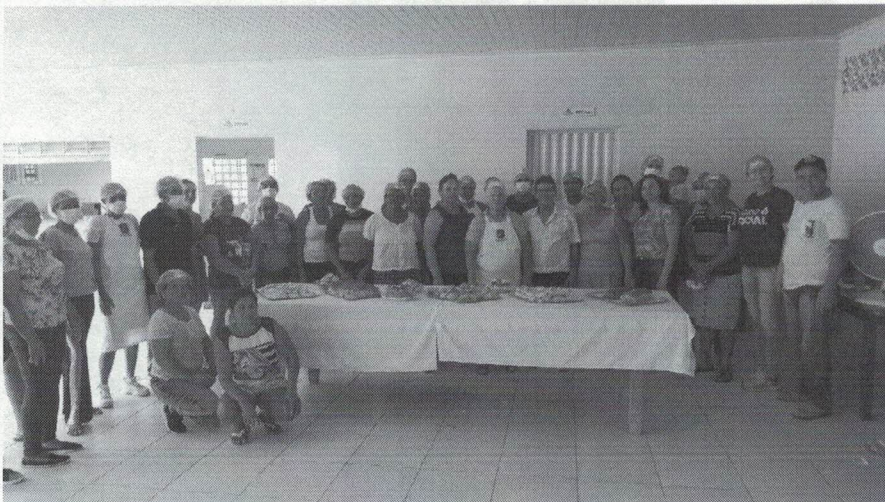
Curso de Panificação – Programa Agro é Social PA I & II